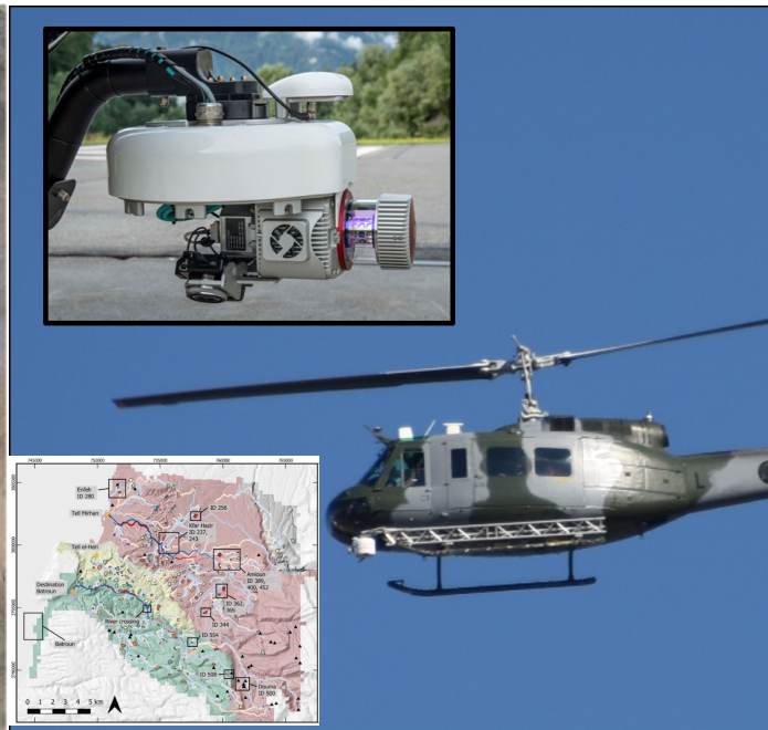
Fieldwork & Lidar generated map, Chekka, Lebanon (Jakob Rom)